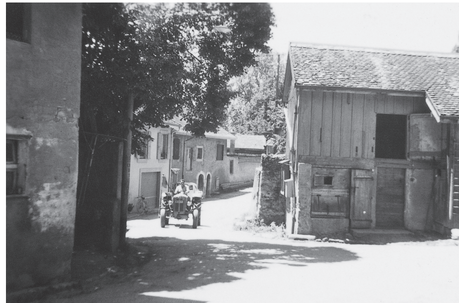
Le centre du village avant 1974.