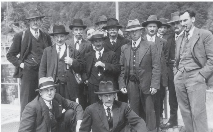
Première course des pompiers dans les années 30.